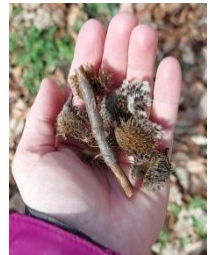
Abbildung 10. Naturmaterialien zum Rutschen

Arbeitsschritt 2: Naturmaterialien wie Bucheckerlhüllen, kleine Äste, Eicheln und ähnliches (Abb.10), können über die abgenommene Rinde runter gerollt werden, wie bei einer Rutsche oder Kugelbahn.