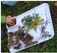
Abbildung 1. Naturmaterialien