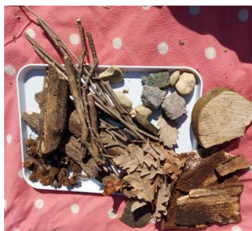
Abbildung 11. Naturmaterialien