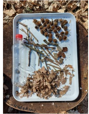
Abbildung 6. Material für die Flaschenrassel

Jede Rassel klingt anders, je nachdem mit welchen Materialien diese befüllt wird.