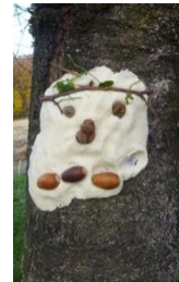
Abbildung 5. Salzteiggesicht

Variante: Salzteig kann auch hervorragend draußen verwendet werden. So können den Bäumen zum Beispiel Gesichter gegeben werden (Abb.4 und Abb.5). Man klebt den Salzteig an den Baumstamm und die Babys können die Naturmaterialien hineindrücken.