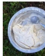
Abbildung 3. Salzteig