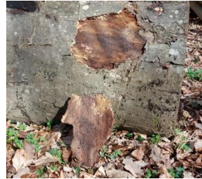
Abbildung 9. Runter gekletzelte Rinde/ Rindenrutsche

Arbeitsschritt 1: Die Babys können je nach körperlicher Entwicklung vor den Baumstamm gelegt oder gesetzt werden. Am besten mit Gatschhose oder auf einer Picknickdecke. Durch eigenständiges Handeln können sie die Rinde mit ihren Fingern runter kletzeln (Abb.9). Kleine Tierchen können unter der Rinde entdeckt werden. Für Babys ist es interessant, diese mit ihren Augen zu verfolgen.