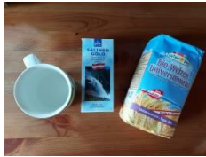
Abbildung 2. Zutaten für den Salzteig