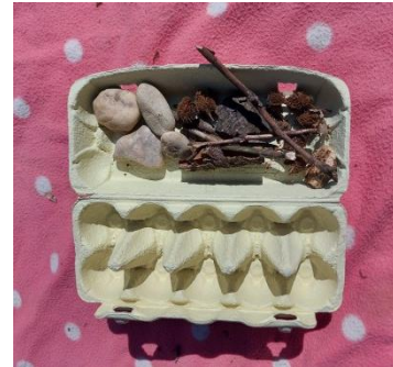
Abbildung 12. Eierschachtel mit Naturmaterialien

Die Materialien werden in den Deckel der Eierschachtel gegeben (Abb. 13). Je nach Lust und Laune können die Babys hingestellt oder selbständig hin krabbeln und probieren, die Materialien in die Eierschachtel zu legen. Hier gibt es verschiedene Varianten, wie die Materialien eingeordnet werden können.