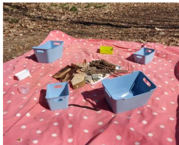
Abbildung 11. Vorbereitete Umgebung

Die Materialien (Abb.12) werden auf einem Tablett verteilt, welches auf einer Decke liegt. Umliegend sind verschiedene Gefäße aufgestellt (Abb. 11). Die Babys können, je nach körperlicher Entwicklung, zu den Materialien hingesezt werden oder sie krabbeln von alleine hin. Durch das genaue Betasten und Erforschen lernen sie die Materialien kennen. Wenn sie wollen, können sie diese in ein Gefäß räumen und/oder wieder ausleeren. Wichtig ist es hierbei den Babys die Möglichkeit zu geben, frei zu handeln, je nach Experimentierfreudigkeit der Babys und ohne den Eingriff von Erwachsenen. Bei Gefahr in Verzug, muss natürlich eingegriffen werden.