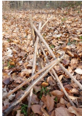
Abbildung 8. Steckerlmikado

Alle Steckerl werden auf einen Haufen gelegt (Abb.8), die Babys haben nun die Möglichkeit, eines nach dem anderen rauszuziehen. Die Steckerl können genau betrachtet werden. Es ist zu beobachten, dass sich die Form des Steckerlhaufens bei der Entfernung eines jeden Teiles verändert.