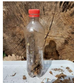
Abbildung 7. Fertige Flaschenrassel