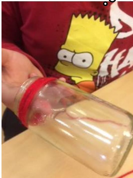
@ Isabella Trummer

Tipp: Mit verschieden farbigen Wollfäden wird das Windlicht lebendiger.