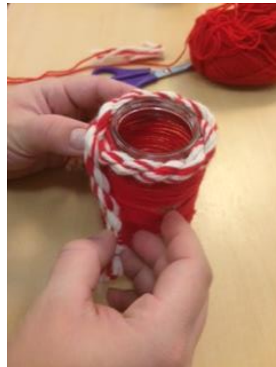
@ Isabella Trummer